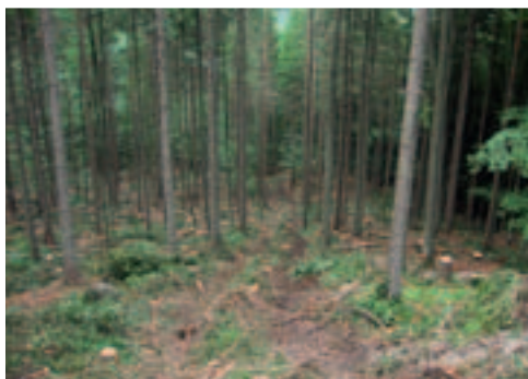
Moderne Technik braucht ein erfahrenes Team.