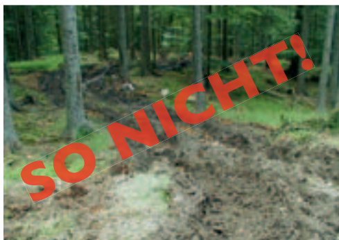
Herkömmliche Forwardertechnik ohne Seil.